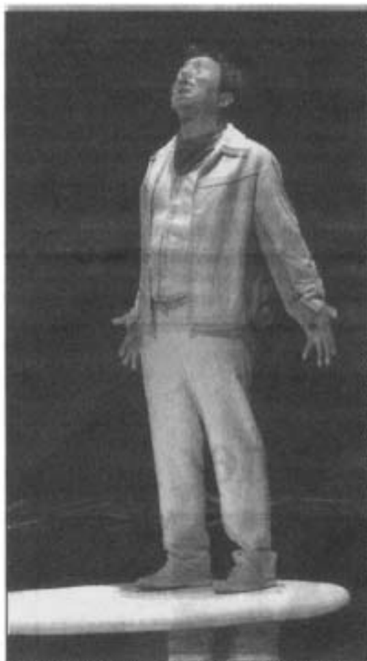
Aux Bouffes du Nord, l'artiste-conteur prêche le faux pour retrouver le vrai.

Il explique – mais est-ce vrai – que l'idée de ce spectacle lui est venue dans le désert du sud marocain. Il a pris un jour en stop un